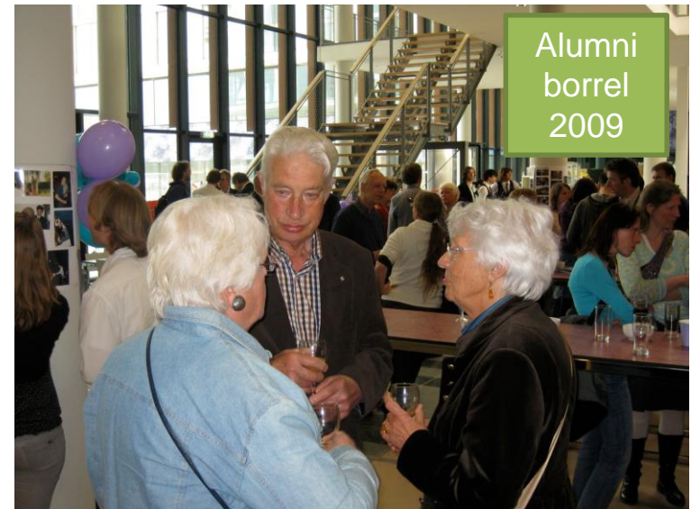
Alumni borrel 2009