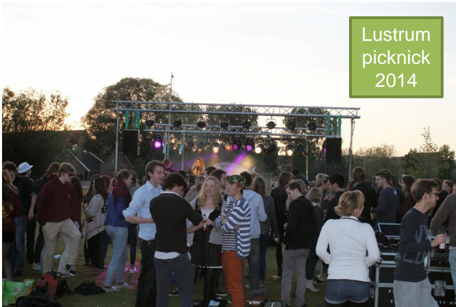
Lustrum picknick 2014